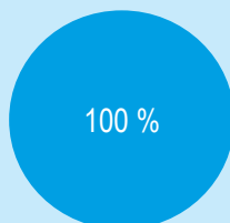
1. Zosúladenie investícií s Taxonómiou EÚ vrátane štátnych dlhopisov*

● Zosúladené s taxonómiou ● Nezosúladené s taxonómiou