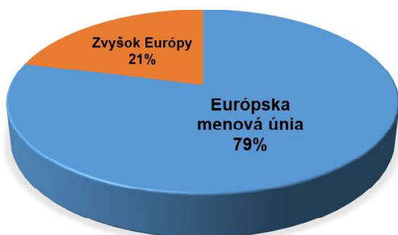
ROZDELENIE PODĽA KRAJÍN